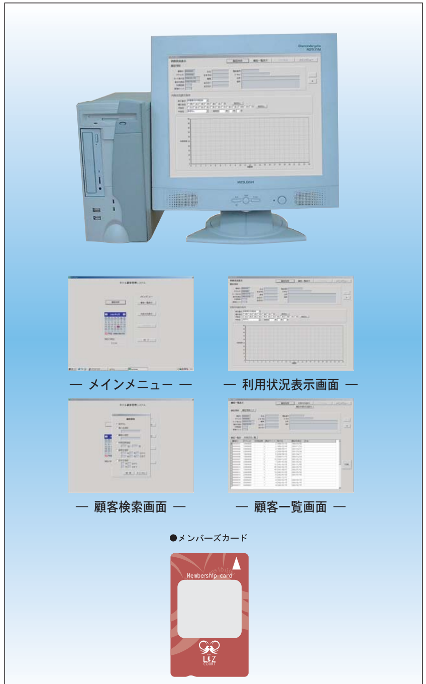
— メインメニュー —

24時間以内の予約が出来ます。 客室管理ホストコンピューター (MH-01)に表示します。